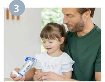
يُزال غطاء VORTEX