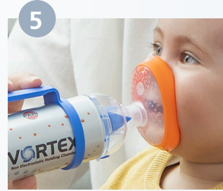
يوضع القناع بإحكام على الفم والأنف

في حالة رشات الرذاذ المتعددة في الاستخدام الواحد: تكرر الخطوة 6