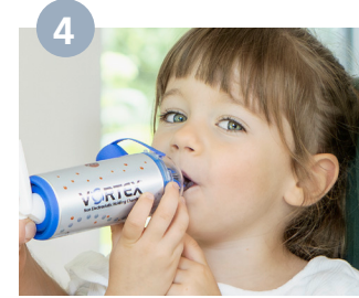
تؤخذ قطعة الفم بين الأسنان ويتم إحاطتها بالشفيتين