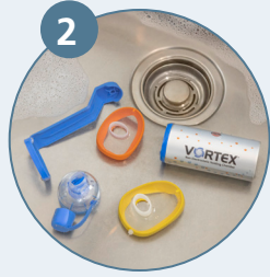
يتم التنظيف بالماء الدافئ باستخدام منظف، ويُغسل بالماء التنظيف