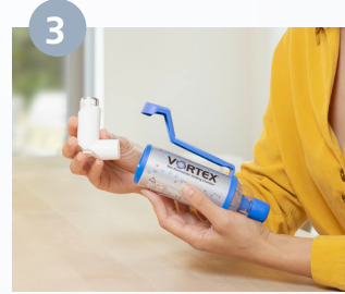
يتم إدخال الرذاذ في حلقة التوصيل وضغط أداة المساعدة بيد واحدة