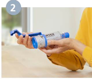
يتم تحريك أداة المساعدة بيد واحدة فوق الحيز الاسطواني