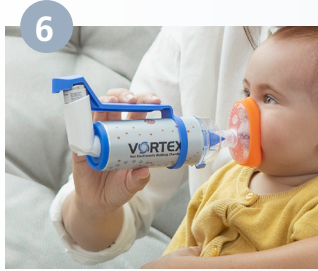
يتم إطلاق الرذاذ، يتم أخذ شهيق وزفير بعمق وببطء