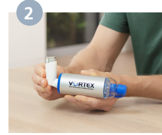
يوضع الرذاذ في الجزء الخلفي من VORTEX