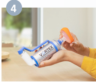
يُزال الغطاء ويوضع القناع