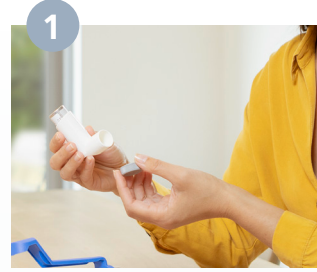
يُزال غطاء الرذاذ، ويتم الرج بقوة