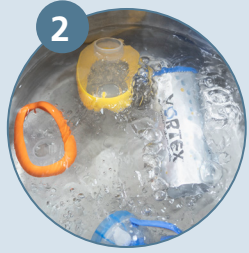
يتم الغلي للتعقيم، 5 دقائق