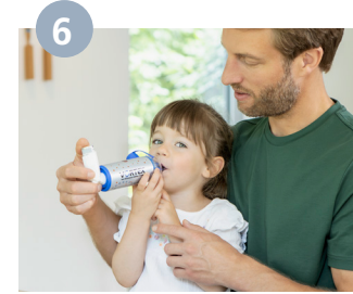
يتم أخذ شهيق وزفير بعمق وببطء